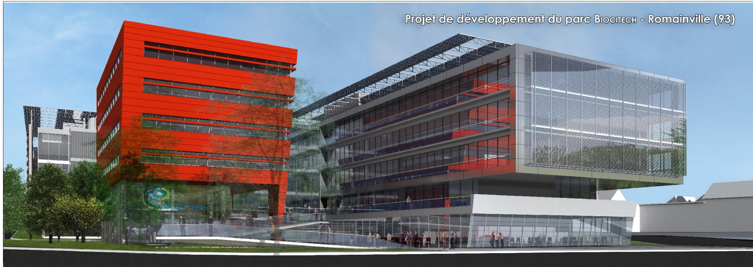
Projet de développement du parc BIOCITECH - Romainville (93)